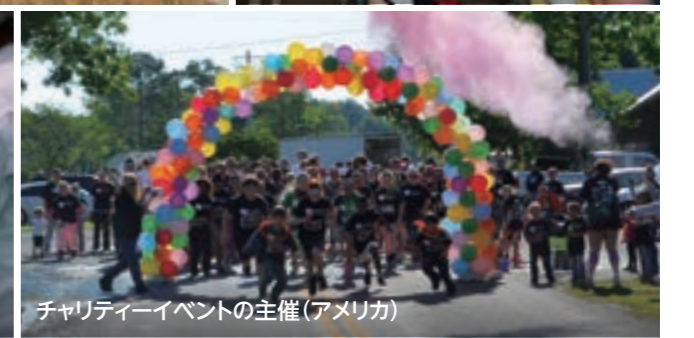
チャリティーイベントの主催(アメリカ)