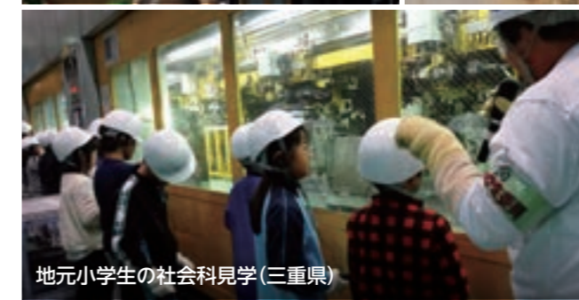
地元小学生の社会科見学(三重県)