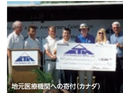
地元医療機関への寄付(カナダ)