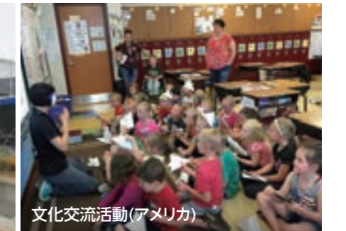
文化交流活動(アメリカ)