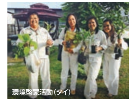
環境啓蒙活動(タイ)