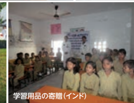
学習用品の寄贈(インド)