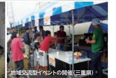
地域交流型イベントの開催(三重県)