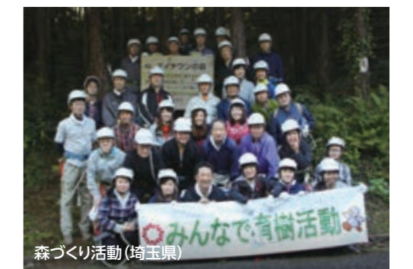
森づくり活動(埼玉県)